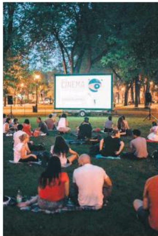
Des documentaires sont projetés en plein air devant des amateurs.

L'événement Cinéma sous les étoiles se déroulera jusqu'au 30 août dans dix arrondissements de Montréal ainsi que pour une première fois à Saint-Bruno-de-Montarville en Montérégie.